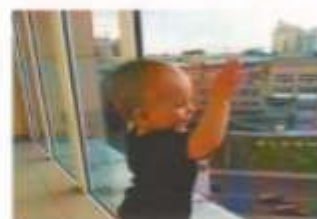
Вместе скарываем зловредные дачи!

Не теряйте бдительность, объясните ребенку, что спрыгивать на окна нельзя, а тем более высовываться наружу.